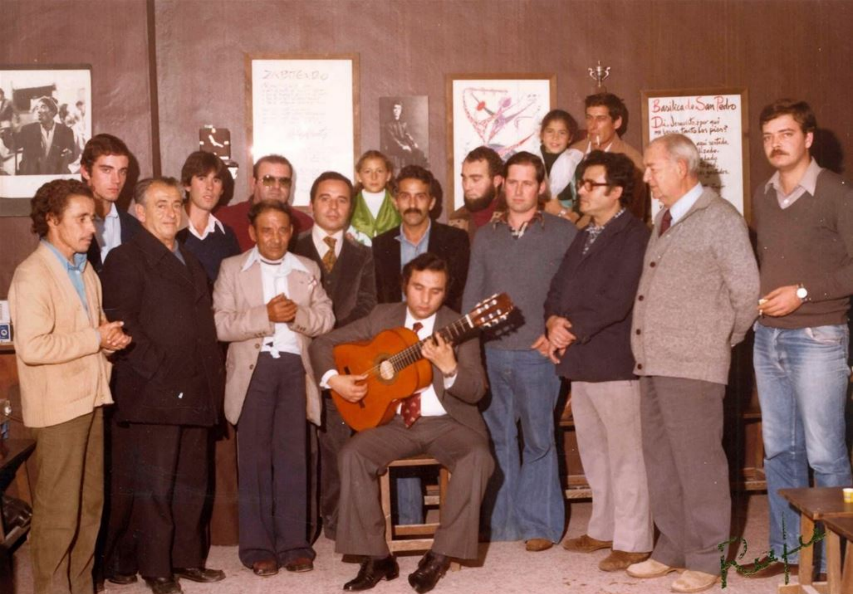
1978-En El Puerto de Santa María, con Parrilla, el Negro del Puerto y amigos